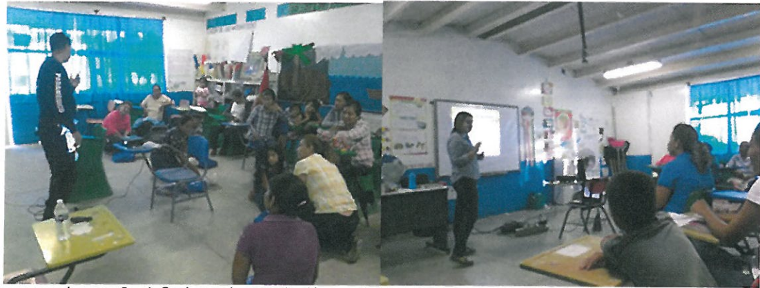
Imagen 3 y 4: Sesiones de capacitación para la Ruta de Turismo Rural de la localidad de Sirebampo, Huatabampo.