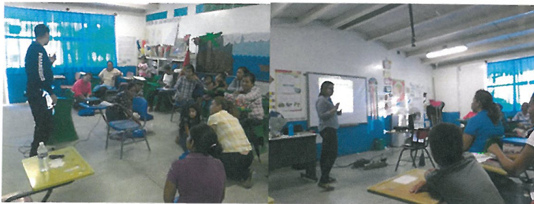
Imagen 3 y 4: Sesiones de capacitación para la Ruta de Turismo Rural de la localidad de Sirebampo, Huatabampo.