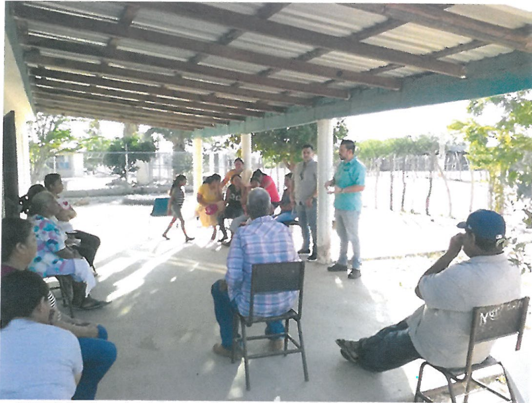
Imagen 2: Reuniones de trabajo para el diseño de la Ruta de Turismo Rural de la localidad de Sirebampo, Huatabampo con maestros de la academia de LAET del Instituto Tecnológico de Sonora.