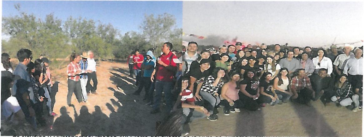
de Navojoa y Huatabampo; Imagen 10: Cierre del evento de la Ruta de Turismo Comunitario en la Localidad de Sirebampo con la participación del Alcalde de Huatabampo, Autoridades tradicionales Mayo, OCV de Navojoa A.C.