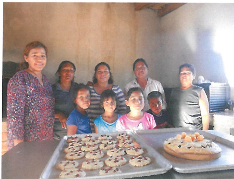
Imagen 12: Capacitación técnica para la elaboración de repostería y panadería baja en calorías a microempresarias de la localidad de Sirebampo, Huatabampo.