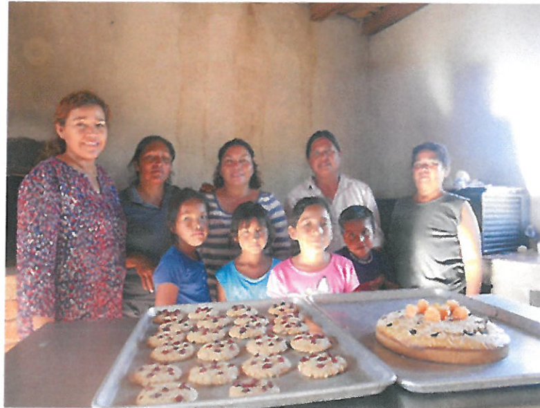
Imagen 12: Capacitación técnica para la elaboración de repostería y panadería baja en calorías a microempresarias de la localidad de Sirebampo, Huatabampo.